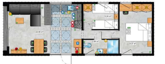
4+2 🚗 1