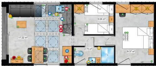
5. 9,9m x 4,09m / 32ft x 13ft 4+2 1